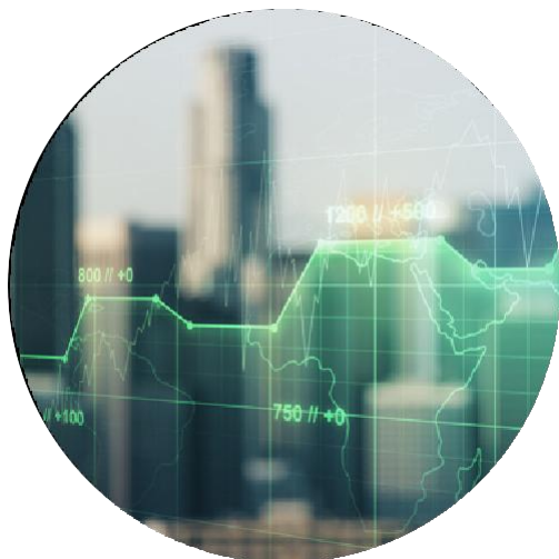
Inflación Tasa de referencia

Resultados sobresalientes, con mejoras en rentabilidad